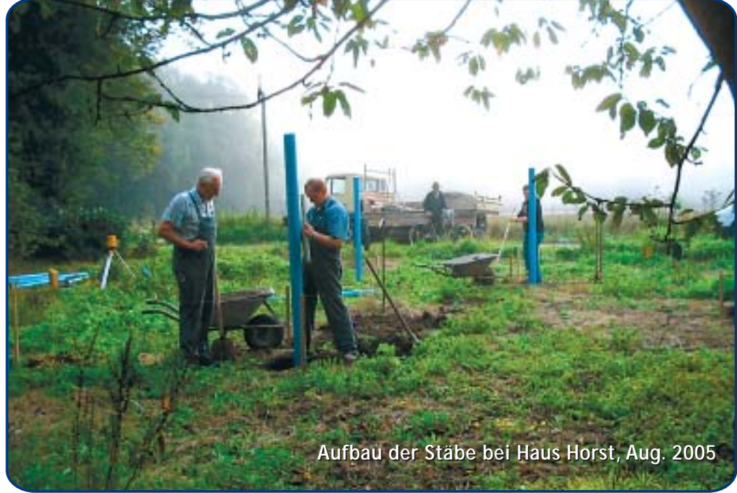
Aufbau der Stäbe bei Haus Horst, Aug. 2005